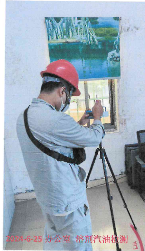
2024-6-25 办公室 溶剂汽油检测